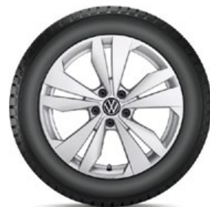
VW Loen Silber